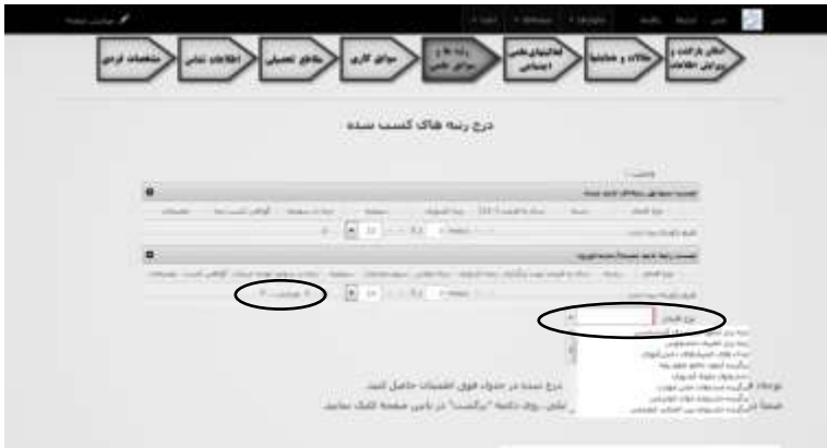
شکل ۶. مرحله درج رتبه‌ها و سوابق علمی

در مرحله «درج رتبه‌ها و سوابق کاری» مشخصات مربوط به رتبه‌های کسب شده از جمله رتبه آزمون سراسری کارشناسی، کارشناسی ارشد، سوابق استعداد درخشان، رتبه در المپیادهای علمی، رتبه در جشنواره‌های مورد تأیید بنیاد و... را در سامانه بارگذاری کنید نحوه افزودن، ویرایش و حذف اطلاعات به طور کامل مشابه درج مقاطع تحصیلی است درج موارد جدید با استفاده از کشور با کس «نوع افتخار» و ویرایش یا حذف موارد ثبت شده قبلی از طریق انتخاب سطر رتبه مورظن و کلیک بر روی دکمه ویرایش یا حذف انجام می‌شود. پس از اتمام ثبت اطلاعات مذکور بر روی دکمه مرحله بعدی « کلیک و در منوی باز شده بالای دکمه گزینه «درج فعالیت‌های علمی، پژوهشی و اجتماعی» را به عنوان مرحله مقصد انتخاب کنید.