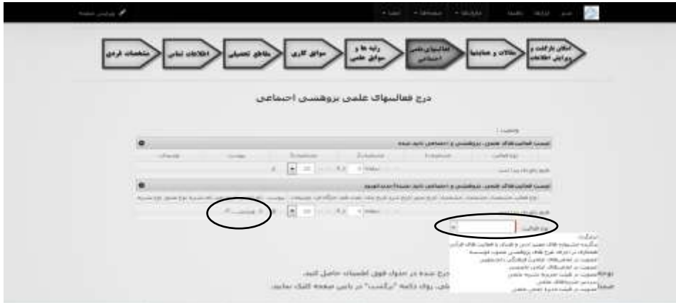
شکل ۷. مرحله درج فعالیت‌های علمی، پژوهشی و اجتماعی

در مرحله «درج فعالیت‌های علمی، پژوهشی و اجتماعی» مشخصات مربوط به فعالیت‌های خود را از جمله عضویت در انجمن‌های مختلف علمی و همکاری در طرح‌های پژوهشی و ... در سامانه ثبت کنید نحوه افزودن، ویرایش و حذف اطلاعات به طور کامل مشابه درج مقاطع تحصیلی است درج موارد جدید با استفاده از کشو باکس «نوع فعالیت» و ویرایش یا حذف موارد ثبت شده قبلی از طریق انتخاب سطر فعالیت مورد نظر و کلیک بر روی دکمه ویرایش یا حذف انجام می‌شود.