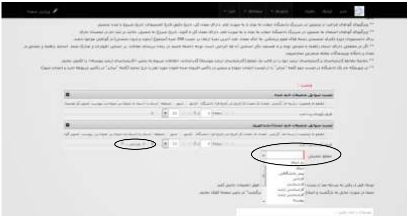
شکل ۴. مرحله درج مقاطع تحصیلی

در مرحله «درج مقاطع تحصیلی» مشخصات مقاطع تحصیلی خود را بارگذاری کنید . توضیحات لازم در مورد نحوه افزودن، ویرایش و حذف مقاطع تحصیلی در بالای صفحه به صورت کامل ذکر شده است . درج مقاطع جدید با استفاده از کشو باکس «مقطع تحصیلی» و ویرایش یا حذف مقاطع ثبت شده قبلی از طریق انتخاب سطر مقطع مورد نظر و کلیک بر روی دکمه ویرایش یا حذف انجام میشود.