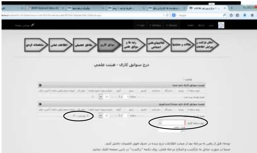
شکل ۵. مرحله درج سوابق کاری

در مرحله «درج سوابق کاری» مشخصات مربوط به سوابق عضویت هیئت علمی و سایر فعالیت‌های کاری خود را در سامانه بارگذاری کنید. نحوه افزودن، ویرایش و حذف اطلاعات به طور کامل مشابه درج مقاطع تحصیلی است درج موارد جدید با استفاده از کَشوباکس «نوع سابقه کاری» و ویرایش و حذف موارد ثبت شده قبلی از طریق انتخاب سطر مورد نظر و کلیک بر روی دکمه ویرایش یا حذف انجام شود. پس از اتمام ثبت اطلاعات مذکور بر روی دکمه «مرحله بعدی» کلیک و در منوی باز شده بالای دکمه، گزینه «درج رتبه‌ها و سوابق علمی» را به‌عنوان مرحله مقصد انتخاب کنید.